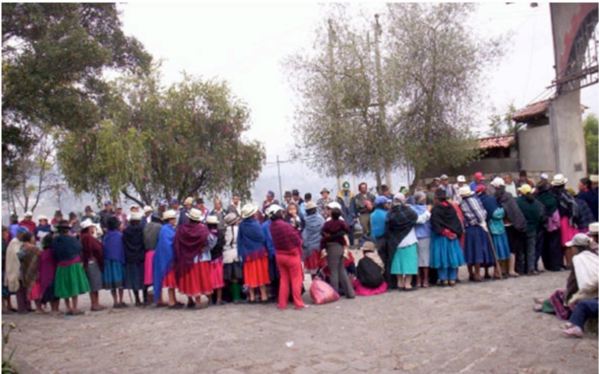
Bild 1: Wartende Indios am Hintereingang des Klosters der Franziskaner von Azogues

Wir haben inzwischen erkannt, dass die Franziskaner von Azogues die „leibliche Dimension“ ihres Ordensauftrages nicht ernst nehmen und dies nicht, weil sie es nicht ernst nehmen können, sondern, weil sie es aus Bequemlichkeit und Arroganz nicht wollen. Sie wählen den bequemen Weg der „diesseitigen Hilfe“, in dem sie einmal im Monat US $ 3.– pro Person buchstäblich als Almosen an der Klosterpforte verteilen lassen. In mittelalterlich anmutender Manier stehen die Menschen Schlange und warten, dass sich die Klosterpforte öffnet um sich unmittelbar nach der Mildtätigkeit wieder zu schließen. Wir empfinden das nicht nur als ungeeignet, sondern auch als respektlos. Vor allem den Männern dient diese „milde Gabe“ häufig zum nächsten alkoholischen Vollrausch, aber auch die Frauen wissen auf Grund ihres geringen Bildungsstandes ohne Anleitung nicht viel mit rein pekuniärer Hilfe anzufangen.