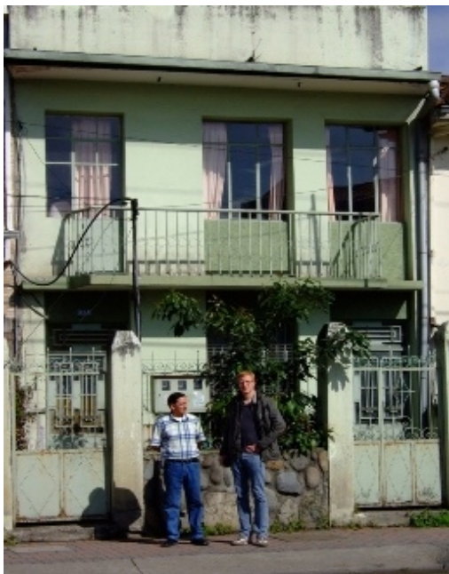
Bild4: Straßenansicht Haus Buestan