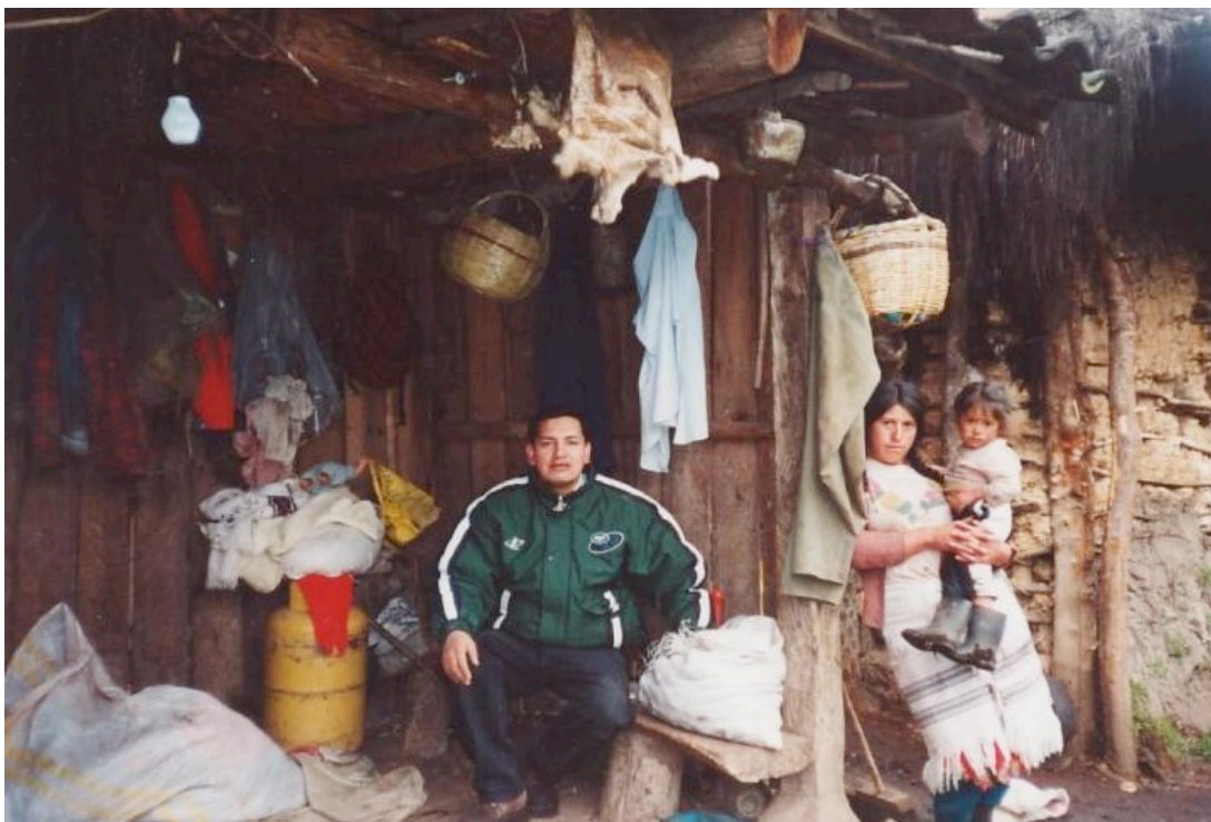
Bild3: Lenin in der Behausung von Hochlandindios, die auf Grund von Erziehungs- und Bildungsdefiziten kaum in der Lage sind, (auch nach ihren Maßstäben) menschenwürdig zu leben. Sie erhalten Almosen von den Franziskanern, was ihnen wenig hilft..

Bild3: linkes Bild: Eine Postkarte, die im Eingangsbereich des Klosters zu kaufen ist. Sie zeigt eine Statue der „Jungfrau Maria auf der Wolke“, die auch die Namensgeberin des Franziskaner-Klosters ist. Die Statue wurde inzwischen auf einem dem Kloster benachbarten Berg fast vollständig errichtet. Das rechte Bild zeigt den Stand der Bauarbeiten während unseres Aufenthaltes in Azogues. Gesammelte Spenden in Höhe von 1.000.000 US $ hätten für die Fertigstellung reichen sollen. Jetzt ist das Geld verbraucht, aber der Kopf fehlt und kann nicht mehr bezahlt werden. Eine Petition an den Papst soll das Problem lösen. Wir konnten uns von der erbärmlichen Qualität dieses Bauwerkes überzeugen und sind geneigt, den bösen Stimmen Glauben zu schenken, die da sagen, dass der Kopf, so er denn je fertig gestellt wird, beim ersten Erdstoß in der erdbebengefährdeten Region bis in die Straßen von Azogues hinunterrollen wird. ----- Die Indios erhalten derweil Almosen und verfolgen das alles mit wenig Verständnis.