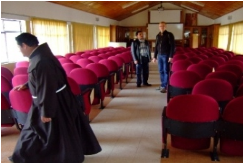
Bild 2: So sieht zum Beispiel der Seminarraum der Franziskaner von Azogues aus. Das Gestühl ist mit feinem Samt bezogen.

Die Franziskaner von Azogues / Ecuador sind ein Bettelorden, ansässig im zweitärmsten Land Südamerikas.