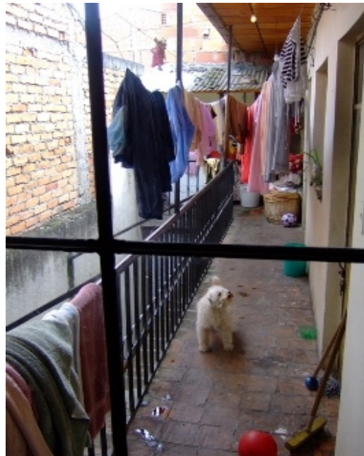
Bild5: Innenhof Haus Buestan

Wir sind uns der Tatsache bewusst, dass wir es uns mit unserer Entscheidung, den Menschen in Ecuador zu helfen, nicht gerade leicht gemacht haben. Ecuador ist nicht nur das zweitärmsten Land Südamerikas www.wikipedia.org/wiki/Ecuador , es gehört auch zu den korruptesten Ländern der Welt. Transparency International stuft Ecuador auf dem Korruptions-Perzeptions-Index auf Rang 151 von 180 untersuchten Ländern ein. Eigene Erfahrungen und diese Zahlen haben uns daher in der Wahl eines ecuadorianischen Partners, mit dem wir glauben, den Indios helfen zu können, sehr vorsichtig gemacht. Erst das Angebot des Franziskaner-Ordens,